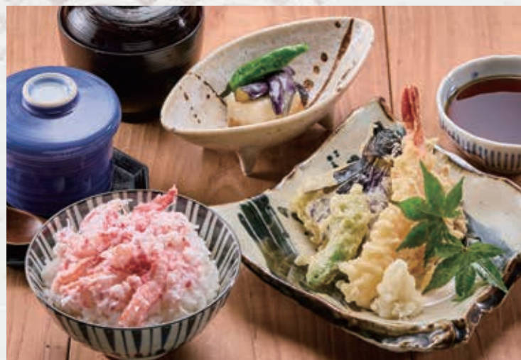
ずわい蟹ちらし御膳