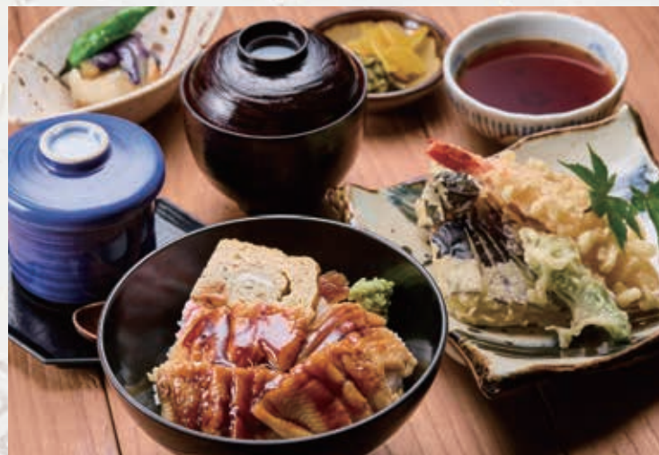
穴子ちらし御膳(酢飯)