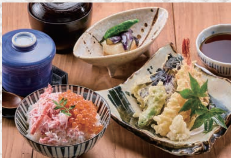
ずわい蟹・イクラちらし御膳